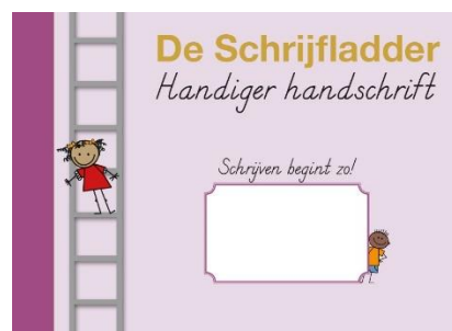
scheurblok 'Schrijven begint zo!'