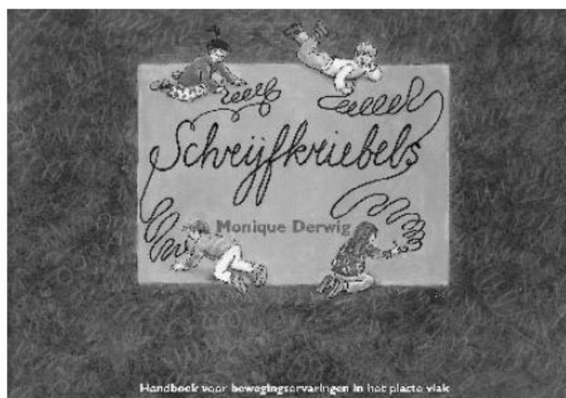
Handboek voor bewegingservaringen in het platte vlak

In JSW van april 2002 zijn zes schrijfmethodes in de rubriek Gereedschap vergeleken. Dit artikel is te vinden op de website van JSW www.jsw-online.nl Op pagina 47 van dit nummer wordt de methode Schrijven op maat besproken.