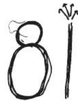
fase 4 losse uitgooiende bewegingen

ringen op. Motoriek ontwikkelt zich niet enkel op basis van rijping, er is tevens voldoende training en ervaring nodig. In de praktijk wordt in toenemende mate gesignaleerd dat kinderen motorisch onhandiger lijken te worden.